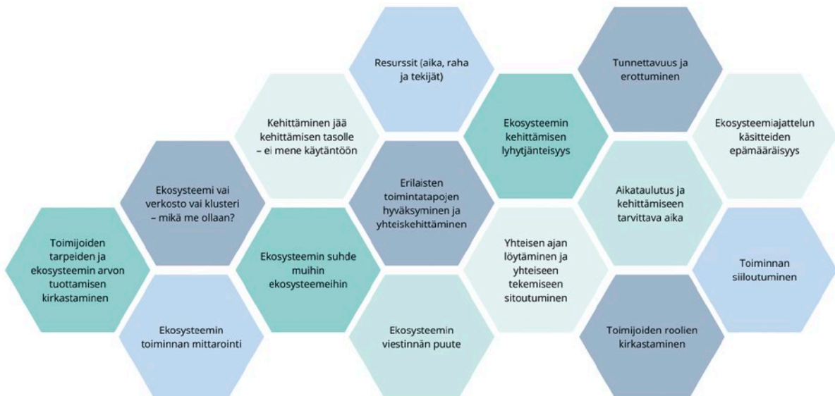
Kuvio 2: Ekosysteemikehittämissä onnistumiset ja kipupisteet