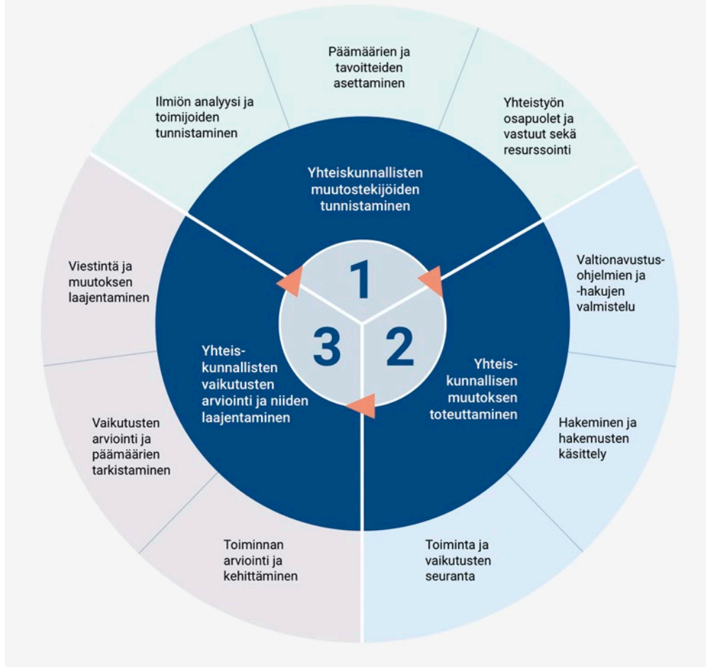
Valtionavustustoiminnan yhteinen toimintamalli.

Yhteiskunnallisen tarpeen analysoinnista kohti vaikutusten arviointia